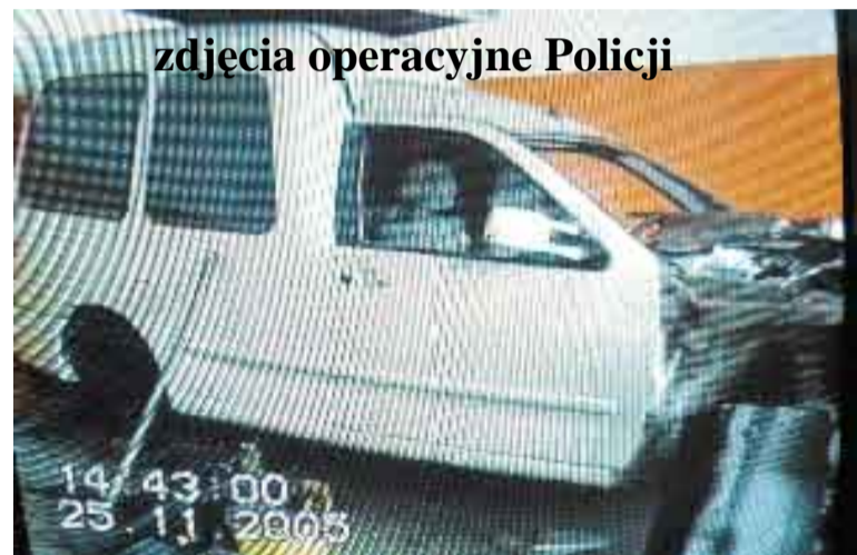
zdjęcia operacyjne Policji

Powiedzenie „najciemniej pod latarnią” tym razem się nie sprawdziło – policja zlikwidowała dwie „dziuple” działające kilkaset metrów od budynku Komendy Powiatowej Policji w Myszkowie, gdzie przestępcy przerabiali na części kradzione samochody.