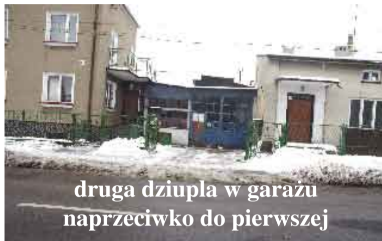
druga dziupla w garażu naprzeciwko do pierwszej

Na razie nie wiadomo jak długo trwał proceder, jednak biorąc pod uwagę liczbę części w dziuplach przy ul. Kościuszki szajka przerabiała skradzione samochody na części od dawna. Jak ustaliła policja auta skradzione na Śląsku rozbiegano na części pierwsze w dwóch warsztatach. To co się dało wymontowywali, a karoserie cięte na drobne części trafiały na złom. Jak podkreśla rzecznik KPP mł. asp. Magdalena Modrykamień sprawa ma charakter rozwojowy. Przystępcy zajmowali się także handlem całymi samochodami – policja ustala, czy sprzedawane auta nie pochodziły z kradzieży.