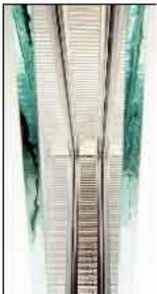
THERMOLINE 1,0 z Termoramką

PZ: Skoro pod uwagę, że sama szyba zajmuje średnio 70% powierzchni okna, to jest ona najbardziej znaczącym elementem, wyalizującym na współczynnik termooizolacyjności w oknach, tak więc dzięki zastosowaniu tej szyby możemy ograniczyć straty ciepła przez okna nawet do 10%! Takie rozwiązanie ma bardzo duży wpływ na oszczędności w rachunkach za ogrzewanie i stan naszego portfela. Zastosowanie w OKNACH z Krakowa szyby THERMOLINE 1,0 oraz Termoramki to gwarancja oszczędności energii cieplnej, optymalnej temperatury w pomieszczeniu, wysokiej przepuszczalności światła oraz zmniejszenia przepuszczalności promieniowania UV. Jednak obecnie nasz Klient może oszczędzić półrocza: dzięki szybce THERMOLINE 1,0 gratis; ulżyć remontowej, gdyż należy pamiętać, że to już ostatni rok jej funkcjonowania; jak również wysokim rabatem.