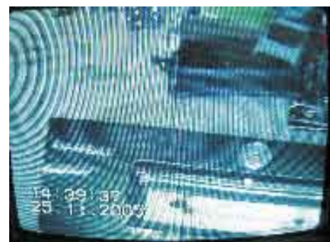
zdjęcia operacyjne Policji