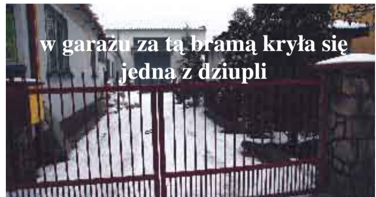
w garażu za tą bramą kryła się jedna z dziupli